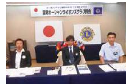
7月第一例会の新3役