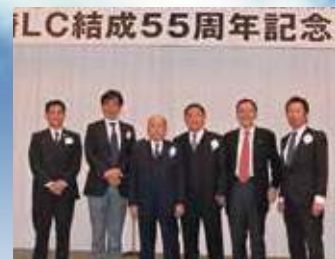
1月18日。宮崎LC55周年記念式典に参加。