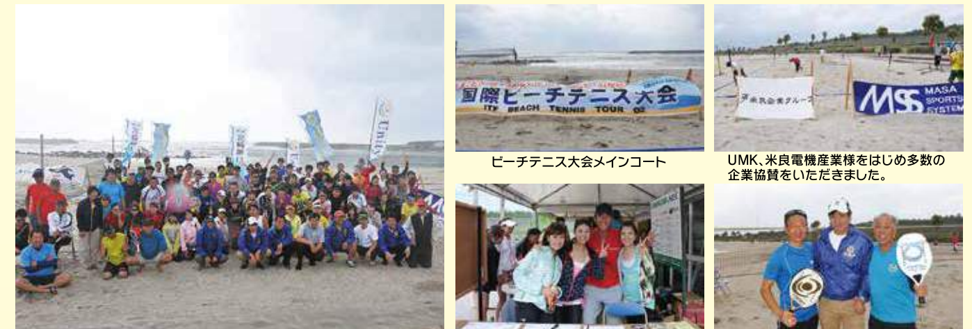
ビーチテニス大会メインコート