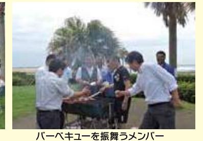
バーベキューを振舞うメンバー