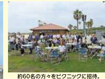
約60名の方々をピクニックに招待。