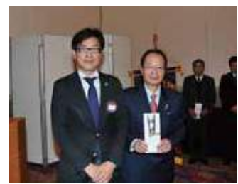
宮崎県アイバンク協力会に助成金を贈呈。