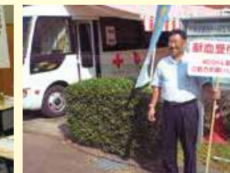
10月29日。宮崎大学で献血活動。