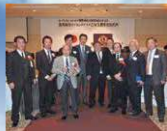
2月7日。高鍋舞鶴LC5周年記念式典に参加。