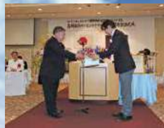
L服部会長から感謝状を授与されるL松下会長。