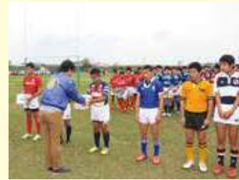
開会式でラグビーボールをプレゼントするL松下会長