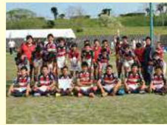
優勝した宮崎ラグビースクール。