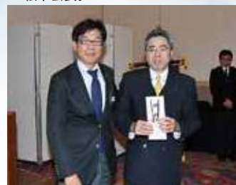
宮崎県移植推進財団に助成金を贈呈。