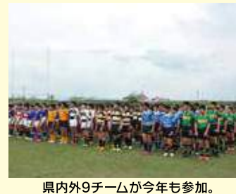
県内外9チームが今年も参加。