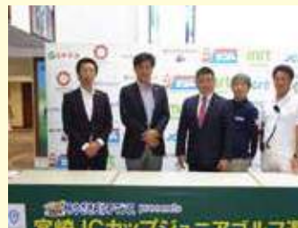
9月20日。宮崎JCゴルフカップを支援。