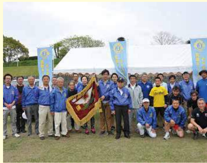
4月5日。第7回宮崎オーシャンライオンズ旗ジュニアラグビー大会開会式。