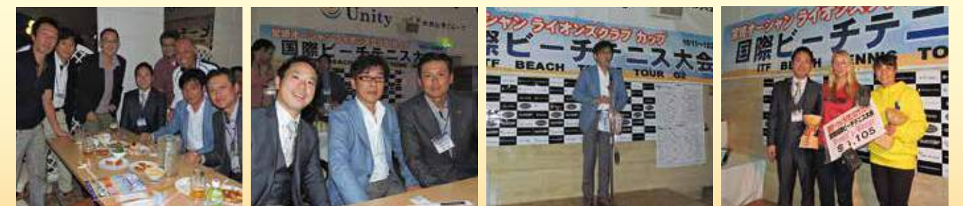
ビーチテニス大会表彰式のもよう