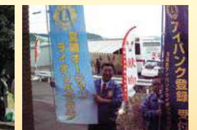
10月22日。マスジユにてクラブ献血活動