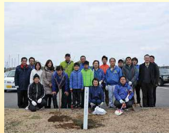
2月11日。サンビーチーツ葉で植樹を行いました。