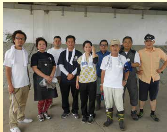
7月13日。大淀川クリーンアップに参加。