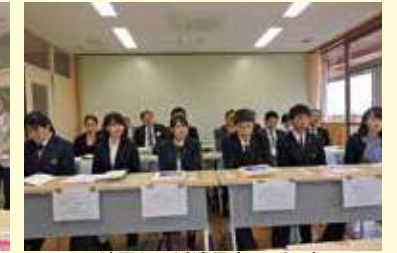
B地区から派遣予定のYCE生。