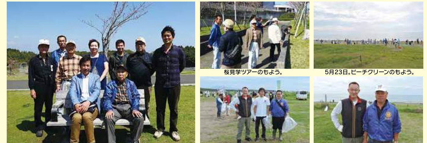
桜見学ツアーのもよう。