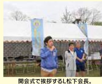
開会式で挨拶するL松下会長。