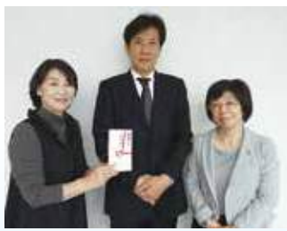
3月27日。NPO法人ハートスペースMに金一封を贈呈。