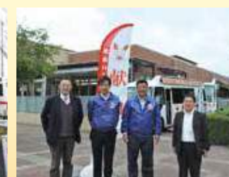
4月14日。宮崎大学で献血活動。