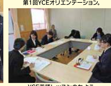
YCE英語レッスンのもよう。