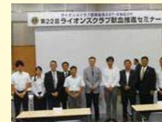
7月2日。B地区の献血セミナーに参加。