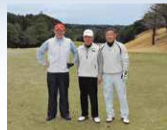
高鍋舞鶴LCゴルフ大会に参加。