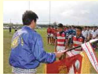
優勝チームに優勝旗を授与するL松下会長