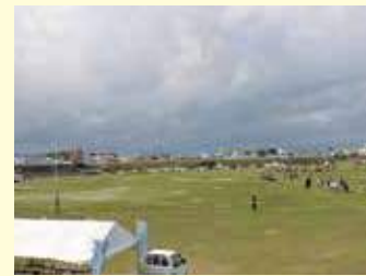
大会会場の山内川グラウンド。