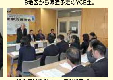
YCEオリエンテーションのもよう。