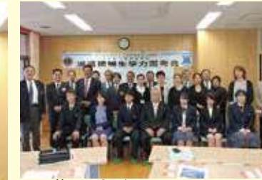
第1回YCEオリエンテーション。