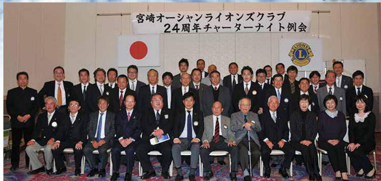
3月3日。第24回チャーターナイト記念例会時の記念撮影。高鍋舞鶴LCをはじめ多数のゲスト、来賓が参加しました。