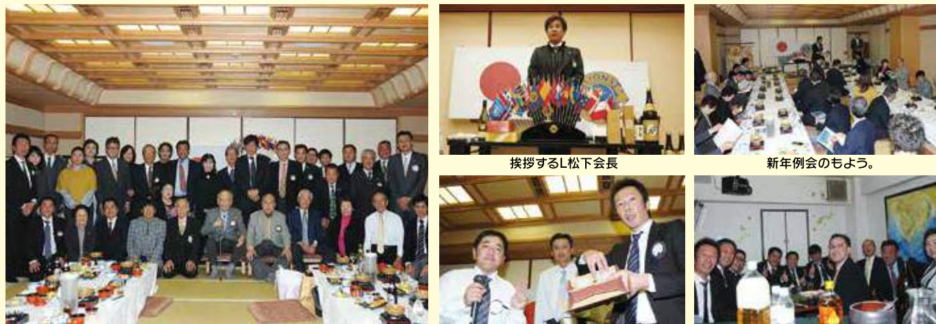
1月21日。新年例会の記念撮影