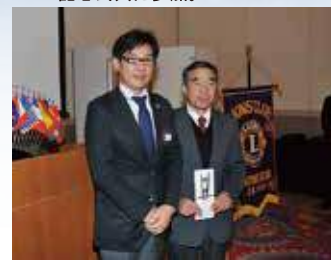
宮崎県ラグビー協会に助成金を贈呈。