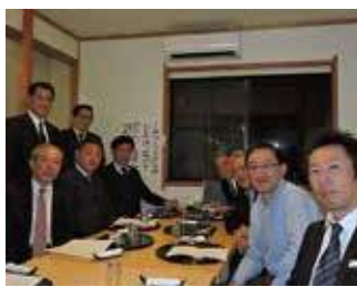
3月25日。次期役員指名委員会。