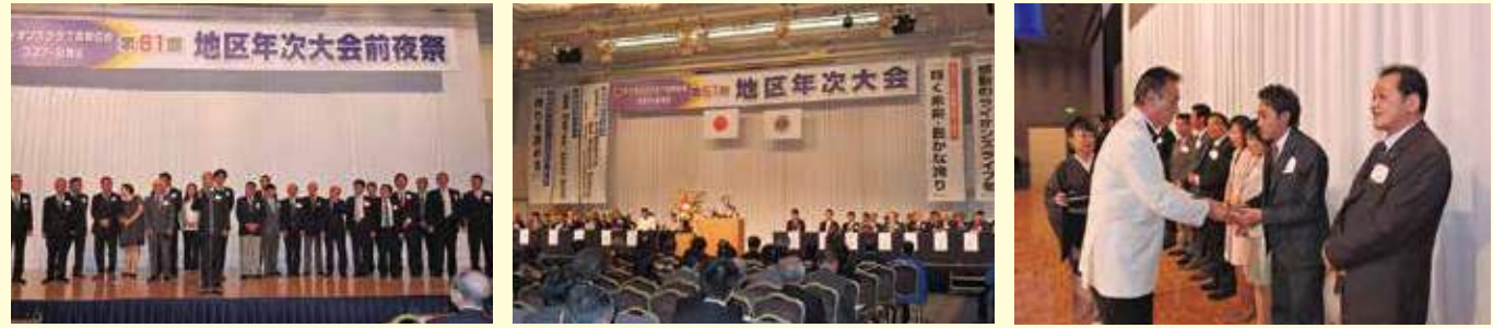
4月18日。地区年次大会に参加したメンバー。