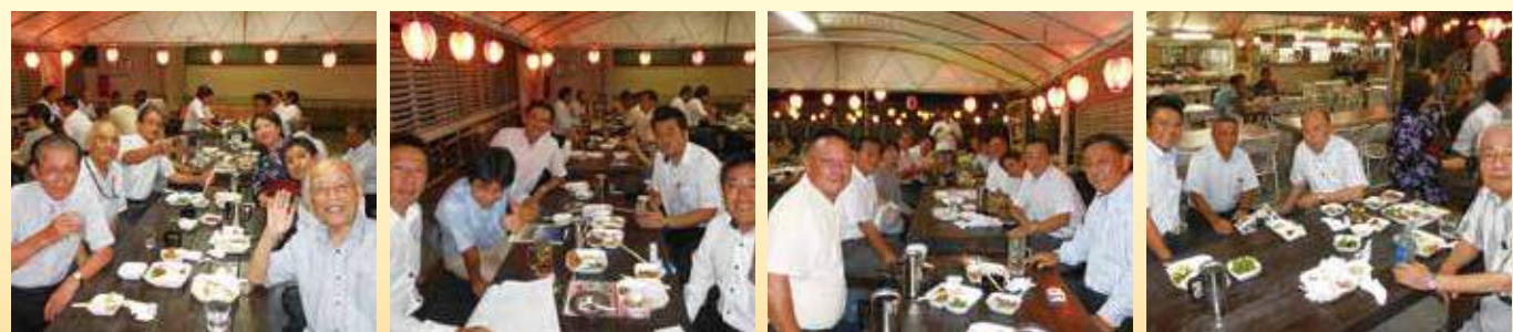
8月20日。ピアガーデン例会のもよう。参加者全員で親睦を深めました。