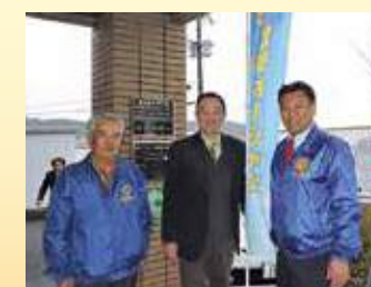
2月26日。マスジユにてクラブ献血活動。