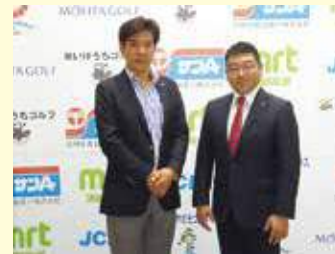
宮崎青年会議所中原理事長とL松下会長。