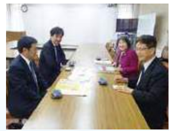
3月27日。宮崎県青少年育成県民会議に金一封を贈呈。