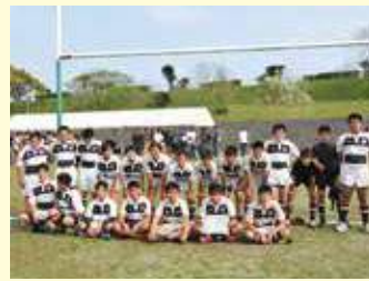
準優勝した延岡・日向・都城RS