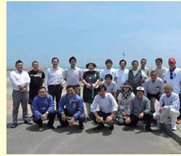
5月19日。サンビーチーツ葉で毎年恒例となっている高齢者福祉アクティビティを開催。