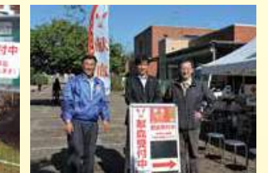
11月27日。宮崎大学で献血活動。