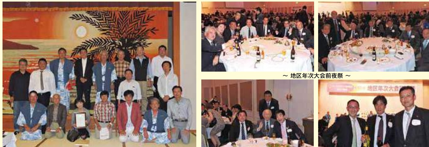
～ 地区年次大会前夜祭 ～