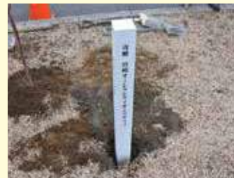
植樹記念を建てました。