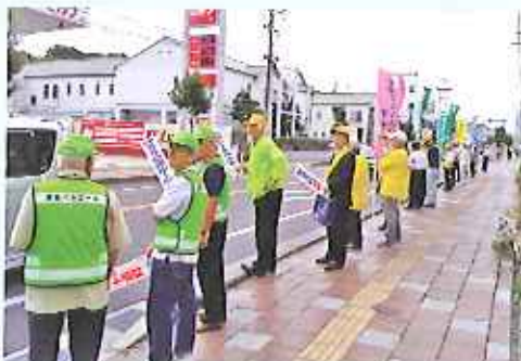
国東市庁舎前に於いて秋の交通安全キャンペーンスタート。