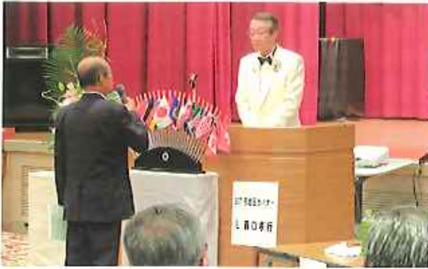
8/31 (土) 1R1.2Z (中津市・耶馬溪文化ホール)