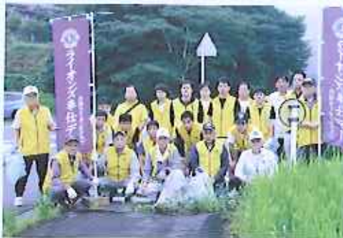
朝6時より口達守佐線の沿道清掃。