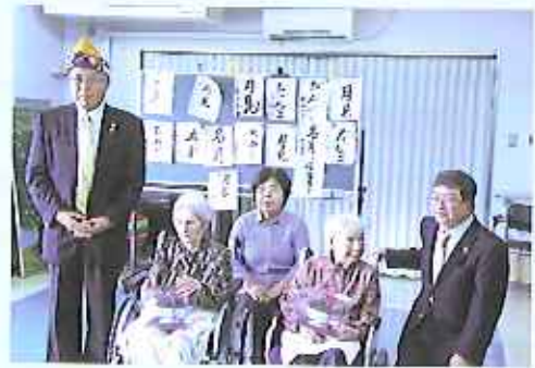
玖珠町内100歳の方7名を教会訪問。