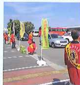
秋の交通安全運動で冷茶サービス。