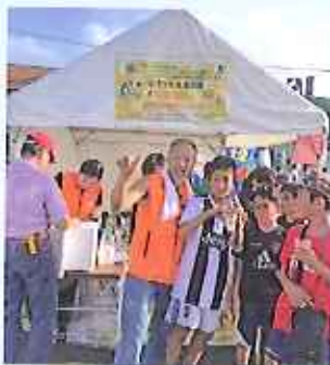
祭り本郷に於いてレモネードスタンド実行。