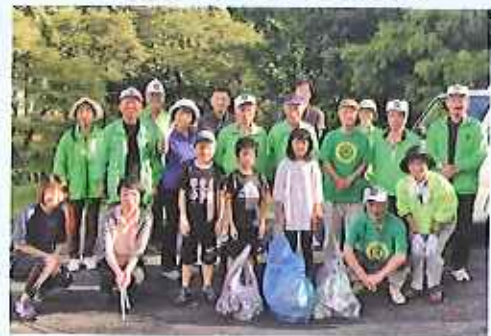
下原良九重線に於いて清掃奉仕活動。