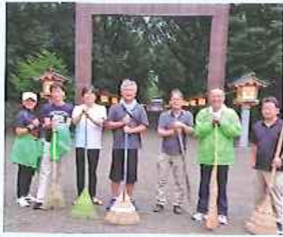
宮崎神宮に於いて清掃活動。