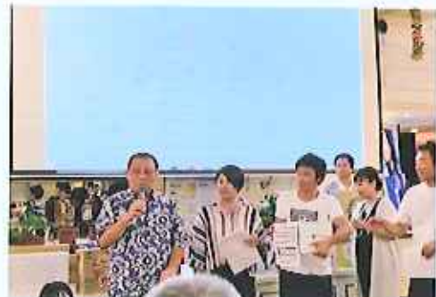
華恋ゴルフコンペ表彰式に於いて小原が収募金活動。