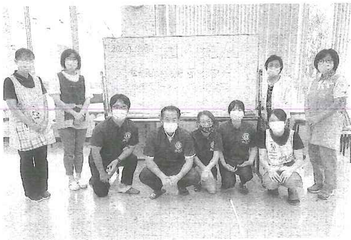
◎宮崎県立こども療育センター お買い物訓練(園内売店) 2020.9.8