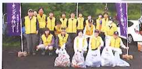
朝6時より玖珠町峠山周辺の清掃活動