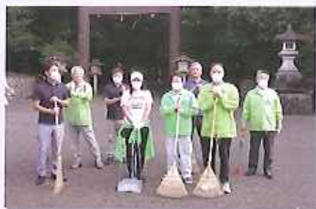
宮崎神宮早稲清掃