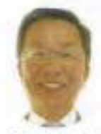
IR3Z ZC L 幸 勝美