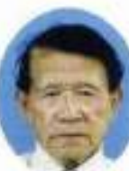
IR2Z ZC L 坂本 征四郎