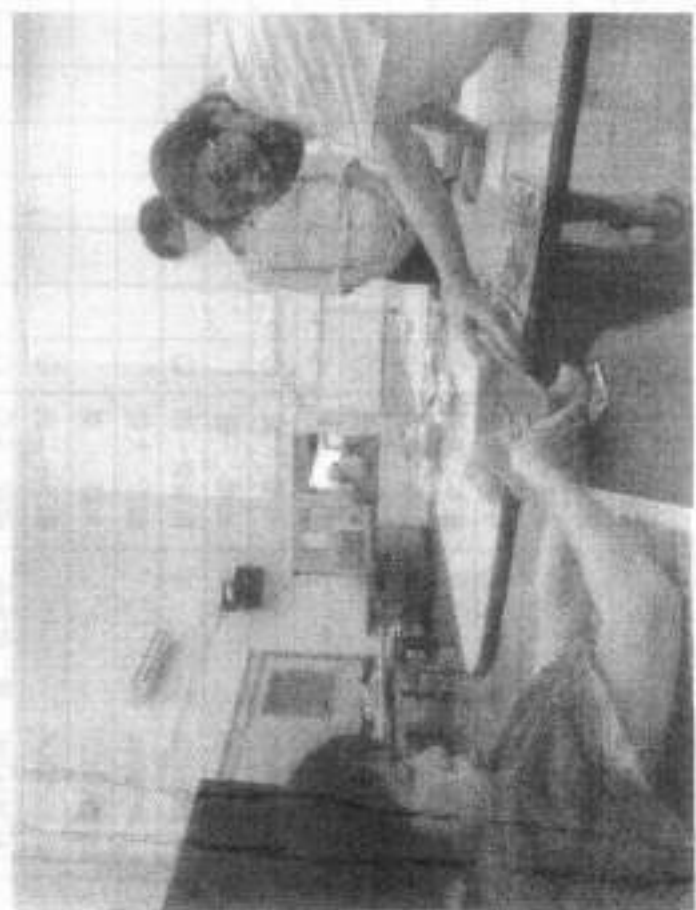
お買い物訓練 2021. 7. 13